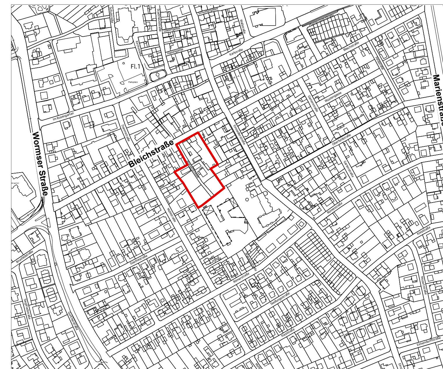
Übersichtsplan ohne Maßstab